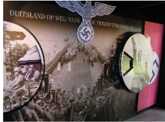
Oorzaken die leidden tot WO-II.

Deze doelen zijn gerelateerd aan de kerndoelen basisvorming geschiedenis die in 1998 zijn vastgesteld. Relevante kerndoelen uit deze lijst zijn: